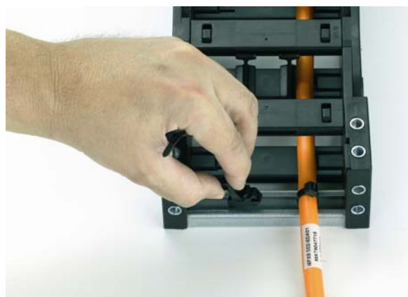
Илл. 0206-02: igus Новую растягивающую разгрузку можно быстро и легко вкрутить в профильные шины типа С без использования инструментов.